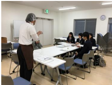
企業との複数回に渡る打合せ