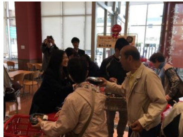
店頭での販売実習