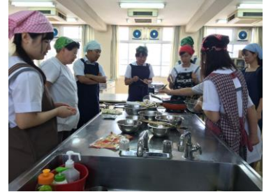
専門家を招いての試作会