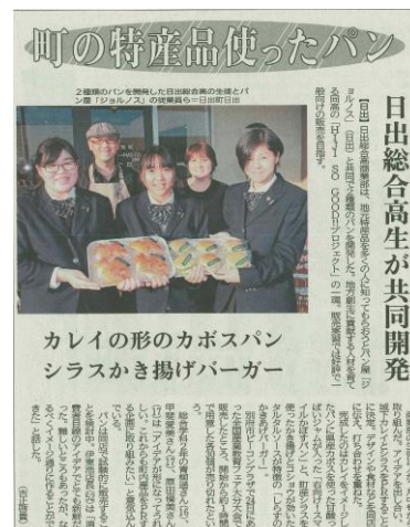
大分合同新聞掲載