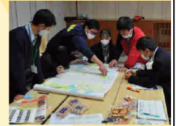
事業者との商品開発ワークショップ