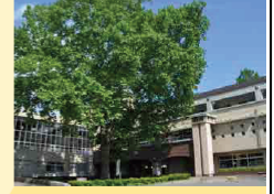
シンボルツリーのプラタナス