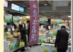
校外での定期的な販売実習