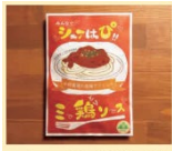
ミートソース/280g(2人前)/常温