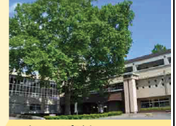
シンボルツリーのプラタナス