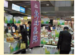
校外での定期的な販売実習