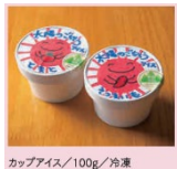
カップアイス/100g/冷凍