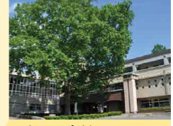
シンボルツリーのプラタナス