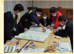
事業者との商品開発ワークショップ